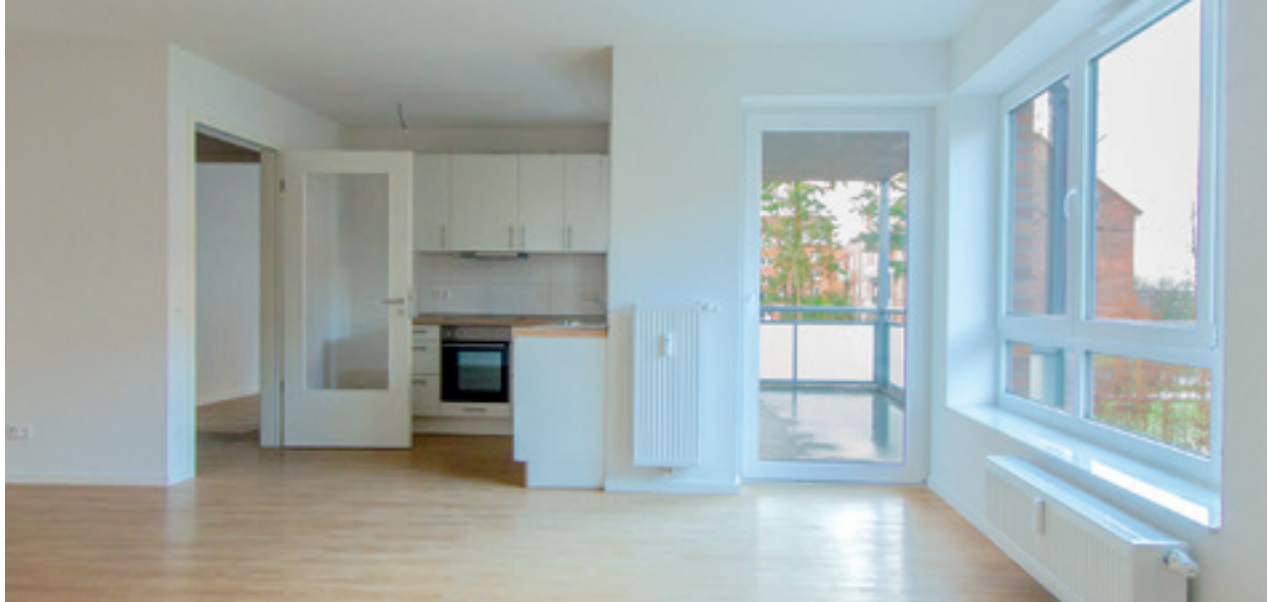
Mehr Licht, mehr Raum: die großzügigen Grundrisse kommen bei den neuen Bewohnern im Mühlenhof Bordesholm sehr gut an.