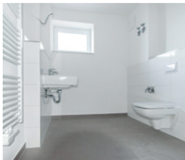
Wohnen am Wasserturm in Flensburg: Treppe in der Maisonette-Wohnung; modernes Bad.