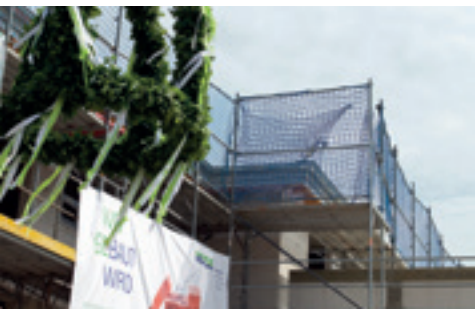
Gemeinsam feiern: Richtfeste